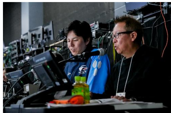
実況・解説の様子