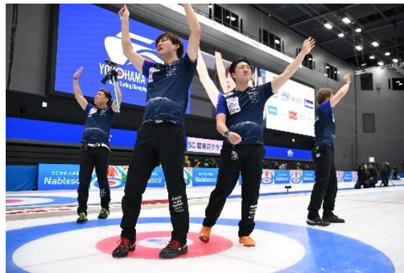
「カーリング日本選手権大会」の様子