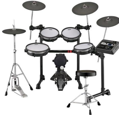
ヤマハ 電子ドラム『DTX6K5-MUPS』

ヤマハ株式会社は、電子ドラム DTX6 シリーズの新製品として、『DTX6K5-MUPS』を5月23日（金）に発売します。