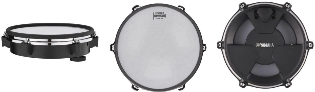
スネアドラム用『XP120L-M』 側面（写真左）、ヘッド部（写真中央）、ヘッド内部（写真右）

アコースティックドラムの演奏感を再現するために、スネアドラム用の『XP120L-M』は12インチ、タム・タム・フロアタム用の『XP100L-M』は10インチと、従来のシリーズよりも大きい口径へ変更いたしました。さらに、アコースティックドラムと同じフープを使用することで、より自然な叩き心地を実現しています。ヘッドには REMO 社製の 2ply メッシュを採用し、好みにあわせたチューニングや高い反発性により軽快な打感を生み出しました。ヘッド部とリム部の 2 ゾーン仕様によりオープン/クローズドリムショットができるほか、ヘッド部には 3 つのセンサーを備えているため、精密なセンシングにより忠実に演奏を再現することができます。