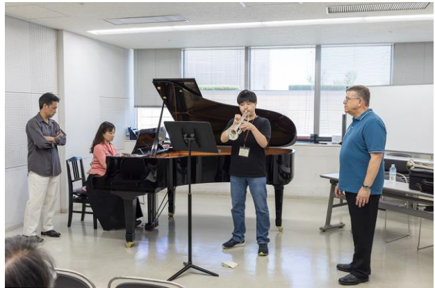
第 29 回浜松国際管楽器アカデミー&フェスティバル レッスン風景 写真左・須川 展也氏 写真右・デイヴィッド・ビルジャー氏