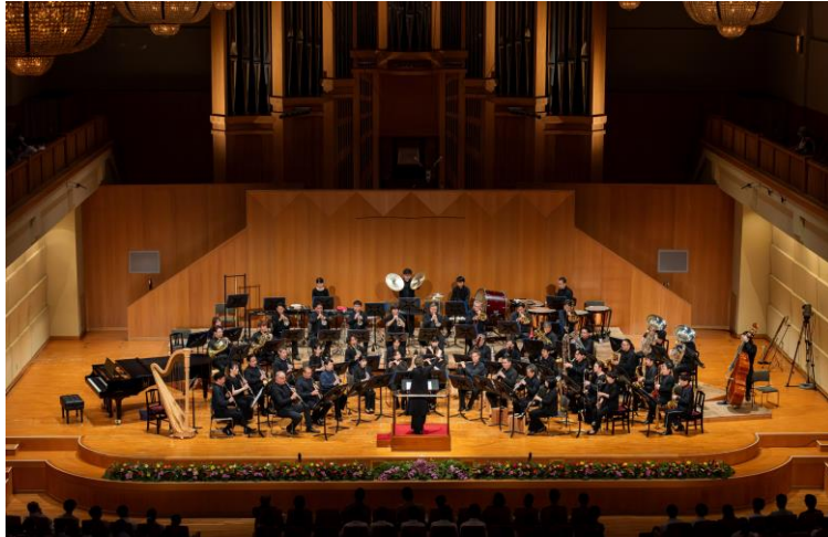
第 29 回浜松国際管楽器アカデミー&フェスティバル 「オープニングコンサート」 より