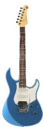
『PACP12 SB』 (左)