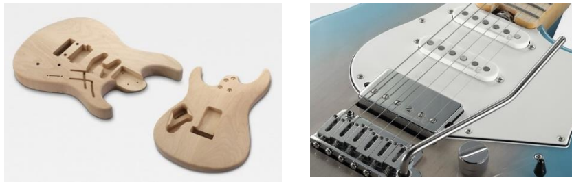
(左) アコースティック・デザインで設計されたボディ構造 (右) Rupert Neve Designs 社と共同開発したピックアップ

当社独自の音響解析や 3D モデリングを活用した科学的設計プロセス「アコースティック・デザイン」により、ボディの振動を最適化させる構造を独自設計し、リッチな中域とタイトな低域を備えた豊かなギターの鳴りを実現しました。また、プロオーディオ機器で高く評価される Rupert Neve Designs 社と共同開発した自社製造のオリジナルピックアップ「Reflectone (商標取得中)」は、パワフルな低音と高音のきらびやかさを両立するクリアなサウンドとなっており、アンプやエフェクターとの相性も抜群です。多彩な音楽ジャンルにフィットし、プレイヤーが望む個性あるサウンドメイクを実現できる表現力を有します。