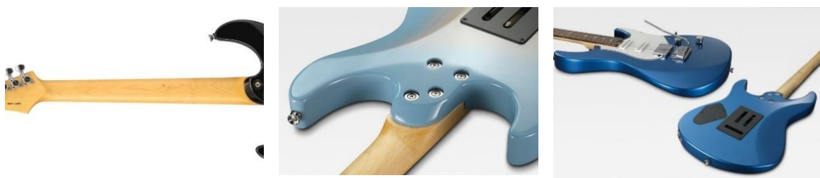
(左) スリムな C シェイプネック (中) ハイポジションでも演奏しやすいネックヒール (右) 体にフィットするコンター加工のボディ

※1: コンパウンドラディアス指板: ローポジション (ナット側) からハイポジション (ブリッジ側) にかけて、表面のカーブが緩やかになるよう加工された指板