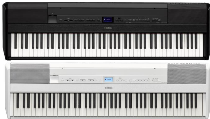
ヤマハ電子ピアノ「Pシリーズ」『P-525』

ヤマハ株式会社（以下、当社）は、ポータブルながら本格的なピアノの響きと弾き心地を再現した電子ピアノ「Pシリーズ」の新製品として『P-525』を11月2日（木）に発売します。