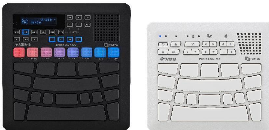
ヤマハ フィンガードラムパッド 『FGDP-50』（左）、『FGDP-30』（右）

ヤマハ株式会社（以下、当社）は、本格的なドラム演奏を、指を使って手軽に楽しむことができる新開発の楽器 フィンガードラムパッド 『FGDP-50』 『FGDP-30』を9月15日（金）に発売します。