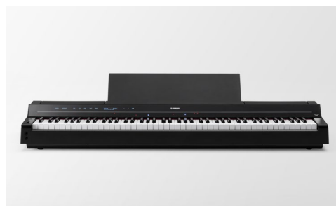
ヤマハ電子ピアノ「Pシリーズ」 『P-S500』

「CSPシリーズ」は、スマートデバイスと連動した革新的な電子ピアノで、鍵盤上部に流れるガイドランプ「ストリームライツ」が弾く鍵盤の位置やタイミングを視覚的に示し、初心者や久しぶりにピアノを演奏される方も楽しみながら演奏ができます。2017年に発売開始し、楽譜が読めなくても自分のペースで演奏することができると好評で、アプリと連携したスマートな演奏体験を提供してきました。