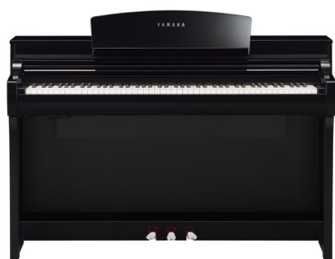
ヤマハ電子ピアノ「Clavinova」 『CSP-275』

ヤマハ株式会社（以下、当社）は、電子ピアノの新製品として、「Clavinova（クラビノーバ）CSPシリーズ」より『CSP-275』『CSP-255』と「Pシリーズ」より『P-S500』を8月10日（木）に発売します。（CSP-275WH/CSP-255WHは10月発売予定）