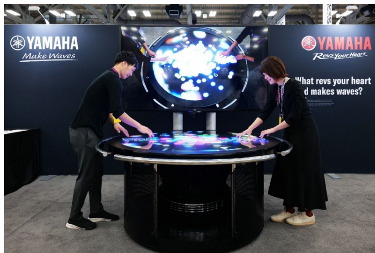
体験型インスタレーション“e-plegona” ※写真はSXSW2023に出展時の様子

ヤマハ発動機株式会社とヤマハ株式会社は、ドイツ・ベルリンで開催される欧州最大規模のイノベーションフェスティバル「hub.berlin(ハブ・ベルリン)」(現地時間6月28日～29日開催)および「Tech Open Air Festival(テック・オープン・エア・フェスティバル)」(現地時間7月5日～7日開催)に、体験型インスタレーション(体験型アート作品)“e-plegona”(エプレゴナ)を共同出展します。本インスタレーションの出展は2023年3月にアメリカ・テキサス州オースティンで開催された最先端テクノロジーの祭典「サウス・バイ・サウスウエスト 2023(略称: SXSW 2023)」に続き2回目です。