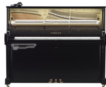
『RSC3 シリーズ』ユニット搭載イメージ

このたび発売するサイレントピアノ後付けユニット『RSC3 シリーズ』、サイレントピアノアップグレードユニット『VSH3 シリーズ』は、本来のアコースティックピアノとしての演奏も変わらずお楽しみいただきながら、最新のサイレントピアノの機能・性能を後付けまたはアップグレードする製品です。これにより、ライフスタイルの変化にあわせて「もっと長く・深くピアノ演奏を楽しみたい」というニーズに寄り添い、長期に渡るピアノライフをサポートします。最新の「アーティキュレーション・センサーシステム」を搭載し、消音演奏時にもピアノ本来のタッチ感を損なう事なく、演奏者が思い描く細やかなニュアンスの表現を正確に検出し、忠実に再現することができます。また、独自のシミュレーション技術により、タッチの細かな違いで音色の変化を弾き分けられ、本格的な演奏表現が可能です。さらに当社のコンサートグランドピアノ「CFX」とベーゼンドルファー社のフラッグシップモデル「インペリアル」をサンプリングした音源を搭載しました。ヘッドホン着用時でも立体感のある自然な音を楽しめる「バイノーラルサンプリング」を「CFX」音源に加えて新たに「インペリアル」音源でも採用しました。その他、当社の無料アプリ「スマートピアニスト」と連携させて各種機能をスマートデバイス上で操作できるなど、利便性が向上しました。