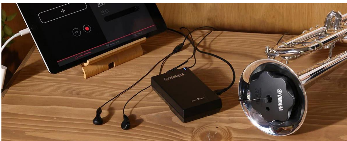
ヤマハ サイレントブラス『SB7J』（トランペット用ピックアップミュート『PM7X』 +パーソナルスタジオ『STJ』）（トランペット本体、スマートデバイスは別売り）

ヤマハ株式会社は、金管楽器用消音システム「サイレントブラス」の新ラインアップ『SBJ』シリーズを、5月25日（木）から発売いたします。また、「サイレントブラス」用のヘッドホンアンプ「パーソナルスタジオ」の新モデル『STJ』とアタッチメントを使用することで新たにバストロンボーンにも対応するトロンボーン用ピックアップアップミュート『PM5X-2』、そして現行PM5Xに装着することでバストロンボーン用ピックアップアップミュートとして使えるアタッチメント『PMAT5X』を単体製品として同時発売します。