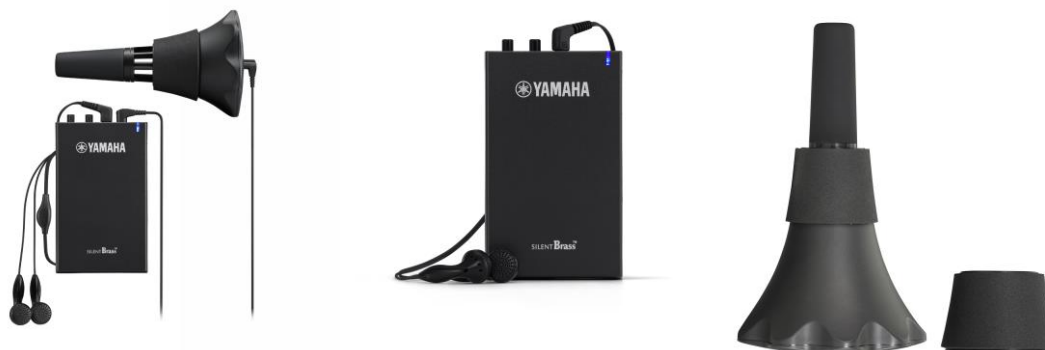
(左) サイレントブラス『SB7J』(トランペット用) (中) パーソナルスタジオ『STJ』 (右) トロンボーン用ピックアップミュート『PM5X-2』

https://jp.yamaha.com/products/musical_instruments/winds/silent_brass/index.html