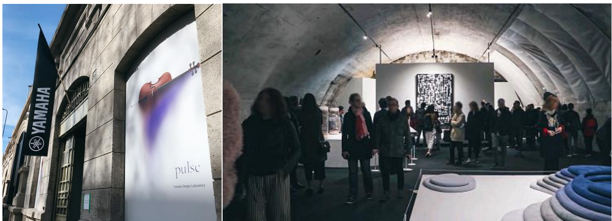
2019年のヤマハブースの様子

※2019年の様子： https://www.yamaha.com/ja/about/design/events_topics/pulse_2019/