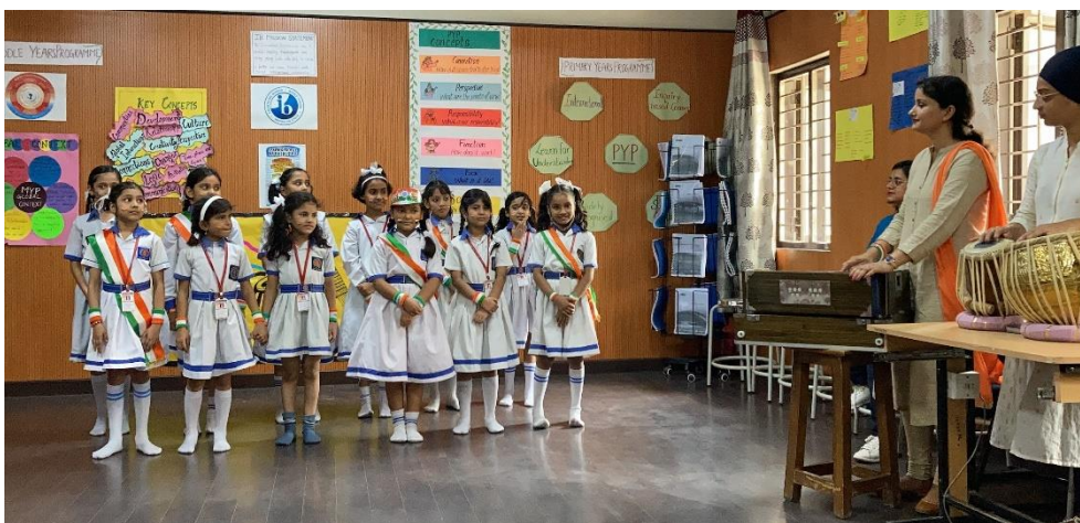
音楽の授業の様子

「EDU-Port ニッポン」は、関係府省や国際協力機構（JICA）、日本貿易振興機構（JETRO）、地方公共団体、教育機関、民間企業、NPOなどが協力して、世界から高い関心を集めている日本の教育を官民協働のオールジャパンで海外展開を推進していく事業です。このたび、当社の取り組みが「令和4年度第2回 EDU-Port ニッポン応援プロジェクト」として選定されたことを受け、成果や課題について文部科学省とも検証・共有しながら日本型教育の海外展開を進めていきます。また、デリー州の教育委員会との連携により、パイロット校との調整支援を得ながら、インド公立小学校での「初等教育への日本型器楽教育導入事業」の展開を目指します。