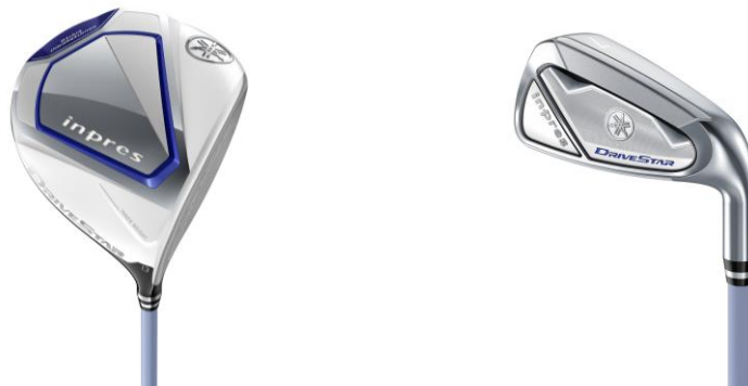
ヤマハ ゴルフクラブ『inpres DRIVESTAR for LADIES』

ヤマハ株式会社は、「inpres」の新シリーズとして、独自のテクノロジーによる飛距離性能と、ミスを軽減しやさしく打てるレディースモデル専用設計に加え、構えやすくスッキリしたデザインを両立したレディースゴルフクラブ『inpres DRIVESTAR for LADIES（インプレス・ドライブスター・フォー・レディース）』を、フルラインアップで10月21日（金）に全国で発売します。