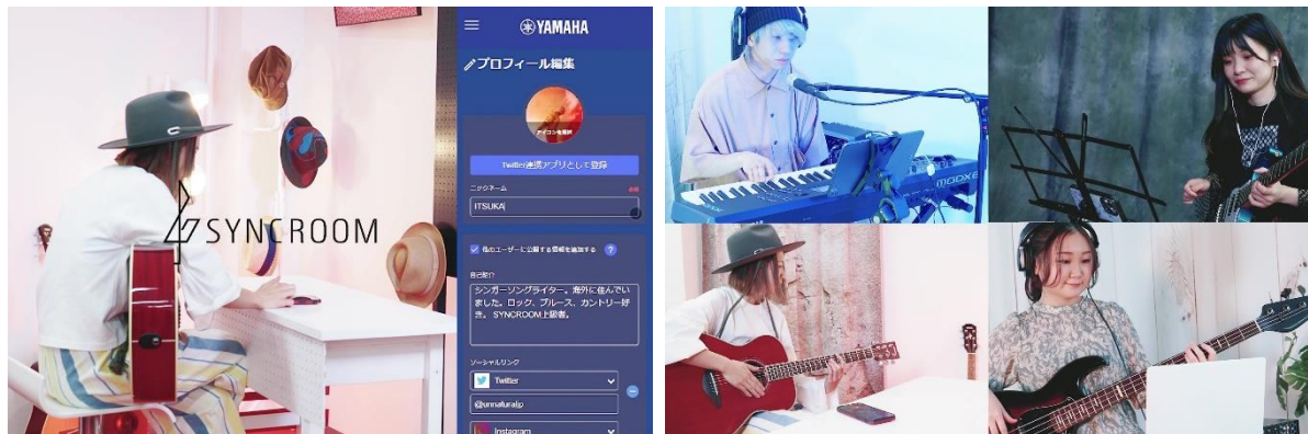
イメージ動画「SYNCROOM - 音で繋がるオンライン演奏アプリ - 4人で初セッション編」

https://www.youtube.com/watch?v=UxPZ6xSvbJY