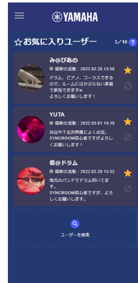
お気に入りユーザー表示の画面イメージ（モバイル版）