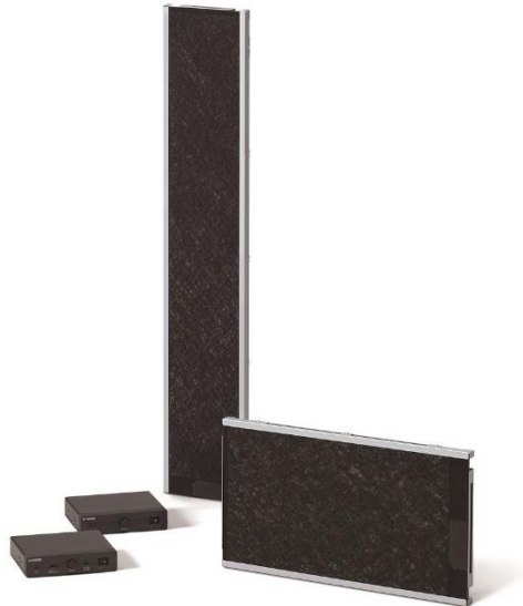
ヤマハ 埋込型平面スピーカーシステム『YFS』

ヤマハ株式会社は、薄く・軽い性質を持つ平面スピーカー「flatone™（フラットーン）」を採用した埋込型の平面スピーカーシステム『YFS』を2022年6月下旬に発売します。