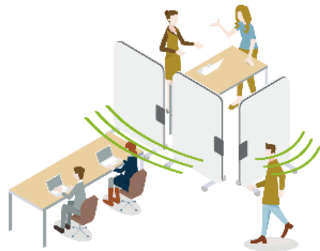
オフィス家具との組み合わせ例： パーテーション