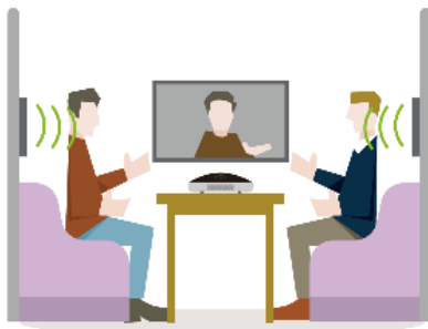
オフィス家具との組み合わせ例： ミーティングブース

薄く軽量で、設置場所の自由度が高い『YFS』は、他の製品との組み合わせを前提とするスピーカーシステムです。他製品やサービスと組み合わせることで「音」の付加価値をあたえ、空間に関わる音の課題解決や新しいソリューションの提案に繋がります。例えば、オフィス家具メーカーとの協業では、コロナ禍で増加した遠隔コミュニケーションによる音問題解決へのニーズに着目し、周囲に Web 会議中の会話音声がかえにくくなる空間と快適な Web 会議を両立するソリューションを提案しています。