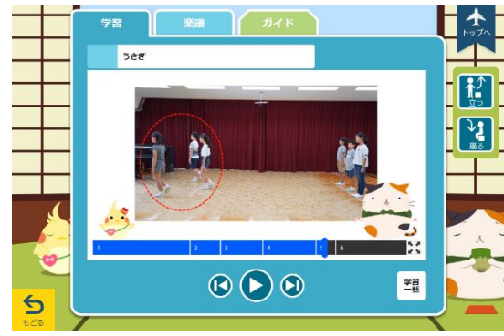
「うた授業」教材画面