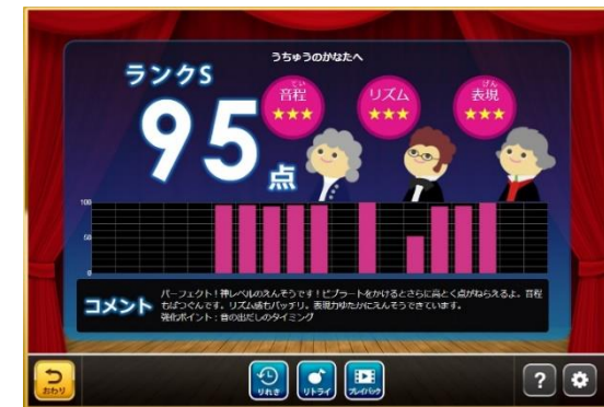
「ソプラノリコーダー授業」教材画面