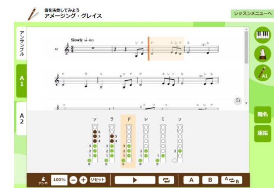
「アルトリコーダー授業」教材画面