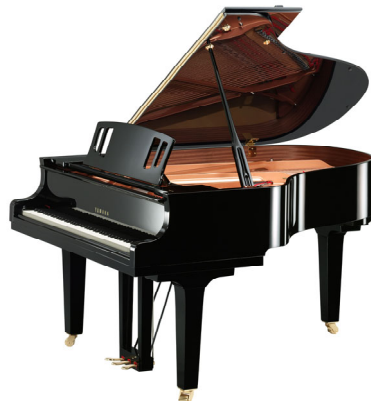
ヤマハ グランドピアノ 『C3X espressivo』

ヤマハ株式会社は、グランドピアノの新製品として、音色・音量の変化の幅が広く、表情豊かな演奏を可能にする高い表現力を備えたグランドピアノ『C3X espressivo (エスプレッシィヴォ)』を、2021年2月10日(水)から発売します。