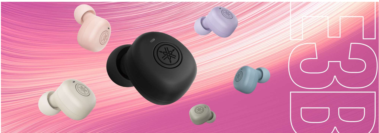
ヤマハ 完全ワイヤレス Bluetooth イヤホン 『TW-E3B』

ヤマハ株式会社は、市場で好評いただいている「リスニングケア」を搭載した完全ワイヤレス Bluetooth イヤホン『TW-E3B』を11月28日より全国で発売いたします。ハウジングサイズのコンパクト化、耳によりフィットするデザインを採用することで、多くのお客様にお使いいただける汎用性と装着性をさらに高めるとともに、ワイヤレス接続の安定性も向上。またカラーバリエーションは、最新のトレンドを考慮し6色に拡充しました。手軽さ、音質、機能へのこだわりのほか、ファッションにも興味を持つ幅広い方々へ、アーティストの表現を余すところなく伝える True Sound、音・音楽のリアリティー表現を通じた感動体験を提供してまいります。