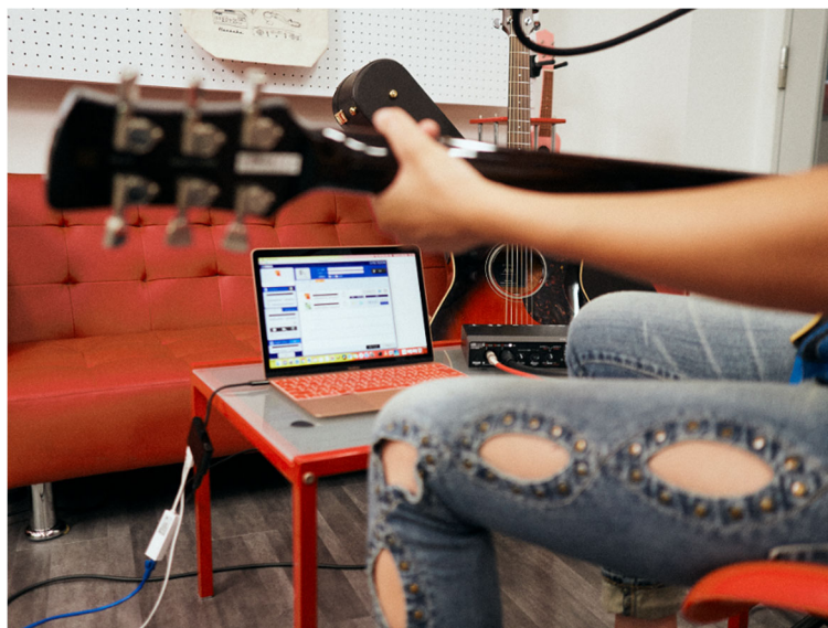
使用シーン（デスクトップ版アプリ）