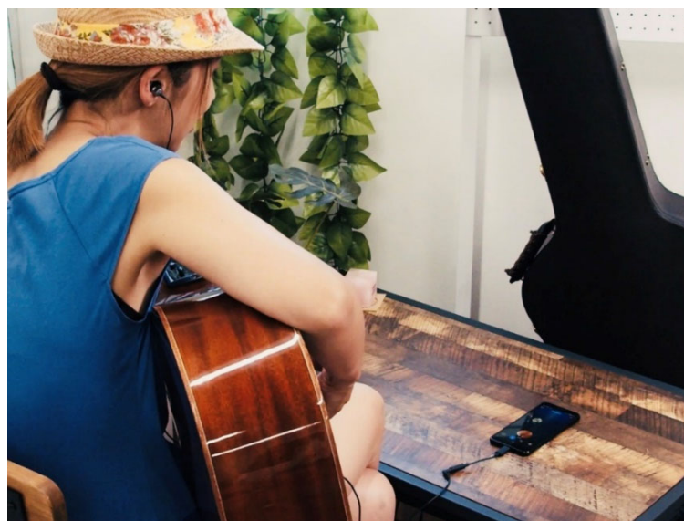
使用シーン（Android版アプリ*5）