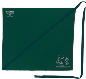
ヤマハ クリーニングスワブ 『CLSM2DPO』 (クラリネット専用)

©Disney ©Disney. Based on the "Winnie the Pooh" works by A.A. Milne and E.H. Shepherd