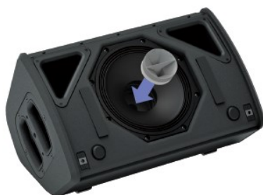
マグネットホーン (オプション品) 取り付けイメージ

* 標準=100° ×100°、オプション「PNT-P10/8FLG11060」装着時=110° ×60°