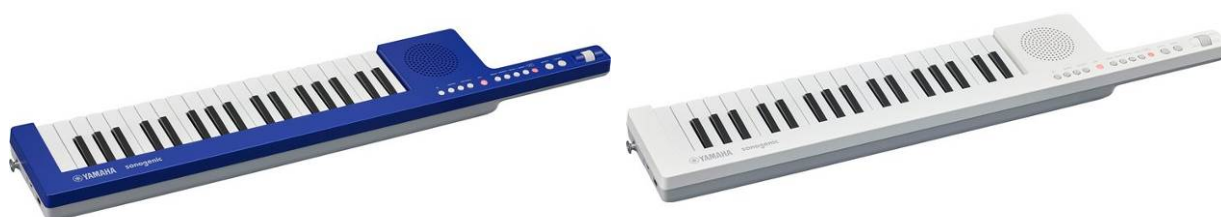
(左から) ヤマハ ショルダーキーボード sonogenic 『SHS-300BU』 『SHS-300WH』

ヤマハ株式会社は、“楽器演奏の知識・スキルがなくても楽しさを体感できる”をコンセプトとしたショルダースタイルの電子キーボード「sonogenic (ソノジェニック)」の新製品として、『SHS-300』を11月13日(水)に発売します。