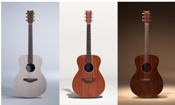
アコースティックギター『STORIA』