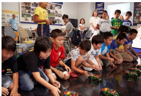
昨年の教室の様子（上段：親指ピアノ「カリンバ」を作ろう 下段：モーター工作教室）