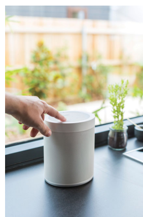
ワイヤレスストリーミングスピーカー 『MusicCast 20』 カラー：(W) ホワイト