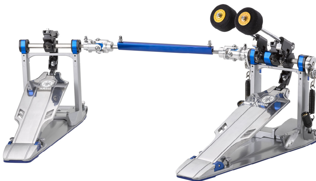
ヤマハ ドラムハードウェア フットペダル 『DFP9D』 価格 78,000 円 (税抜)