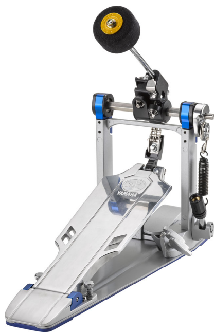
ヤマハ ドラムハードウェア フットペダル 『FP9C』 価格 37,000 円 (税抜)