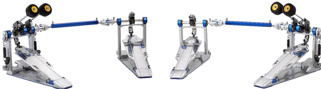
ヤマハ ドラムハードウェア フットペダル 『DFP9CL』 価格 78,000 円 (税抜)