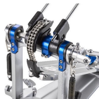
青色が新開発のパーツ

演奏の安定性を徹底的に追求し、フレーム構造の精度を高める新開発の高精度パーツを搭載しました（特許出願中）。内蔵しているボールベアリングの遊びをこのパーツで押さえ込むことによりガタツキを押さえ、より安定した、スムーズな演奏を可能にしています。