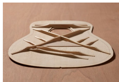
スクヤロップ加工を施したブレイシング

最新の音響解析シミュレーションによる試作工程を経て施した、独自のスクヤロップ加工のブレイシングを新たに開発しました。FG、FSそれぞれのボディシェイプに合わせて最適化したデザインとしており、耐久性を損ねることなくパワフルな中低域の響きを実現しています。また、表板には長期間を経た木材と同様の変化を生む当社独自の木材改質技術「Acoustic Resonance Enhancement (A.R.E.)」を施し、新品でありながら長年弾きこんだかのような豊かな音を奏でます。