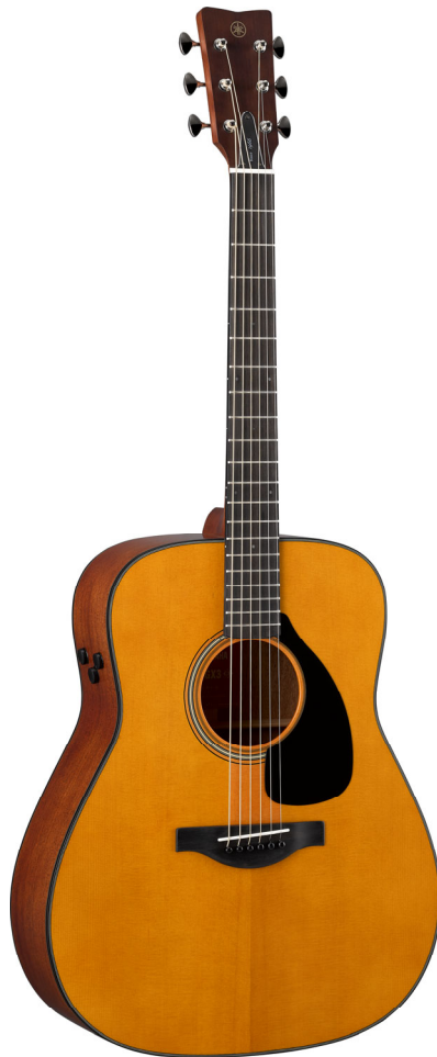
ヤマハ エレクトリック・アコースティックギター 『FG/FS Red Label シリーズ』 『FGX5』 190,000 円（税抜）トラッドウェスタンタイプ