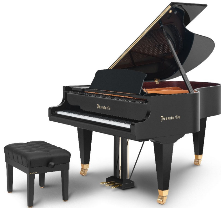
ベーゼンドルファー グランドピアノ 『Model 185VC』