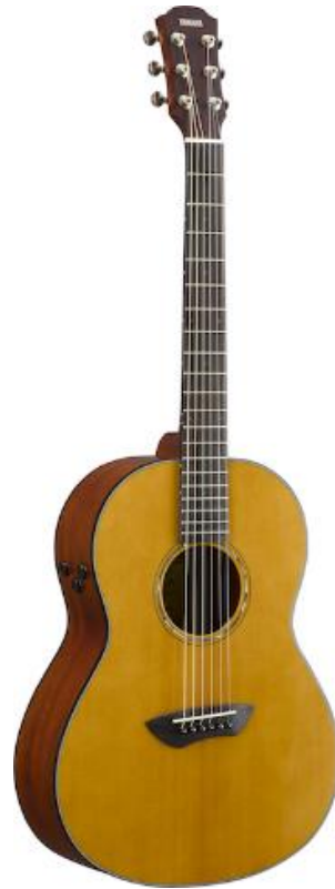
ヤマハ トランスアコースティック™ギター