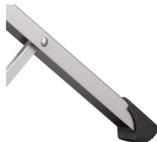
<凹型のチャンネルレッグ構造>