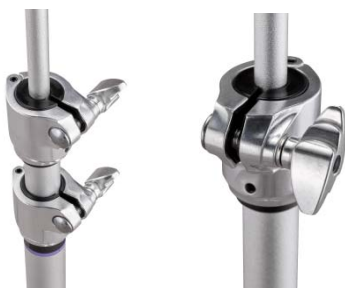
<互換性があり長さの調整が可能なスリーブ>

シンバルスタンドパイプのスリーブに互換性を持つ仕様を採用し、中間パイプ上部スリーブと下部パイプスリーブを交換することで中間パイプに上部アームをセット可能とするなど、コンパクトなセッティングが可能です。また、凹型となるチャンネルレッグ構造の3脚を開発し、セッティング時の安定性と耐久性を実現しました。