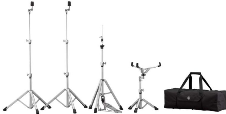
< 『アドバンスドライトウェイトハードウェアパッケージ』 >

ヤマハ株式会社は、アコースティックドラムの新製品としてヤマハ ドラムス 『アドバンスドライトウェイトハードウェア』を9月1日（土）に発売します。