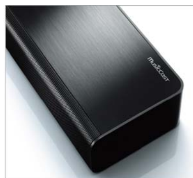
高級感のある洗練されたデザインと質感