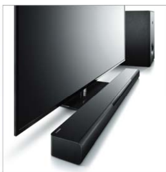
サウンドバーとワイヤレスサブウーファーの構成