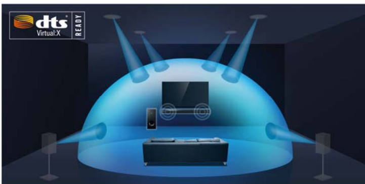
「DTS Virtual:X」バーチャルサラウンド再生概念図