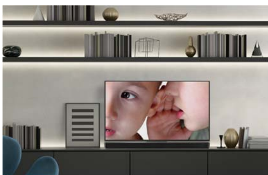
テレビの前にすっきり置けるスリムなバータイプのセンターユニット

*7 対応機種などの詳細は、当社製品サイト ( https://jp.yamaha.com/products/contents/audio_visual/connect/hdmi_cec/ ) でご確認ください。