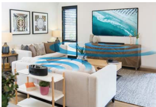
MusicCast Surround機能でワイヤレスリアスピーカーの拡張も可能

*5 「Spotify Connect」の利用には、Spotify アプリ(無料)のインストールと Spotify Premium アカウント(有料)への登録が必要です。