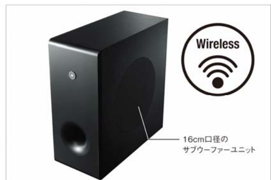
ワイヤレスサブウーファーのサブウーファーユニット