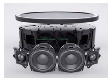
MusicCast 50 内部構造

新開発の 10cm 口径アルミコーンウーファーとホーン形バツフルを備えた 3cm ドームツイーター、専用にチューニングされたパッシブクロスオーバーネットワークを組み合わせたセパレート 2 ウェイ構成のステレオスピーカーを横幅 400mm の大容量キャビネットに内蔵。これをヤマハ製 DSP と最大出力 35W+35W のパワーアンプで駆動することで、広いリビングルームを満たすクリアで迫力あるサウンドを実現しました。また、2 系統のアナログ音声入力端子 (3.5mm ステレオミニジャック、ステレオ RCA ピンジャック)、テレビ音声をつないで手軽に楽しめる光デジタル音声入力端子も装備しています。