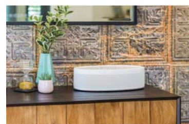
お部屋に自然に溶け込む丸みを帯びたデザイン