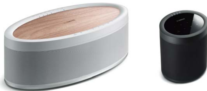
左: MusicCast 50 (MN) 木目/ナチュラル / 右: MusicCast 20 (B) ブラック

今回発売する『MusicCast 50』『MusicCast 20』は、お手持ちのモバイル端末(専用アプリ「MusicCast CONTROLLER」をインストールしたスマートフォン、タブレットなど)やヤマハ製 AV 機器(AV レシーバー、サウンドバー、HiFi オーディオなどの MusicCast®対応機器)とホームオーディオネットワークを構築し、家庭内の好きな場所に置いて音楽を楽しむ「MusicCast®」対応のワイヤレスストリーミングスピーカーです。本機とモバイル端末があれば、モバイル端末内の音楽コンテンツやインターネットラジオ、音楽配信サービス「Spotify」(スポティファイ)や「Deezer HiFi」(ディーザーハイファイ)、サイマルラジオ配信サービス「radiko.jp」(ラジコ ドット ジェイピー)などを高音質で快適に再生できるほか、ネットワーク内にある MusicCast®対応 AV 機器との間で相互に音楽コンテンツの受信・配信を行ったり、複数台の本機をネットワーク内に組み入れて家中の好きな場所で音楽を楽しむことも可能です。さらに、2 台の本機を使って左右独立のステレオ再生を行う MusicCast Stereo 機能、MusicCast®対応の AV レシーバーやサウンドバーと組み合わせて本機をサラウンドスピーカーとして使う MusicCast Surround 機能など、視聴スタイルやネットワーク構成に応じたさまざまな楽しみ方を実現します。