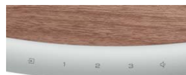
快適な操作を提供するタッチセンサー&お気に入りボタン