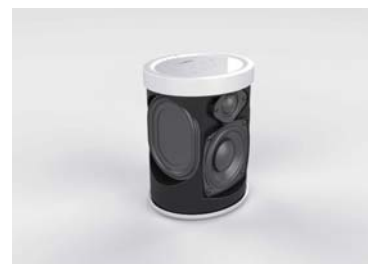
MusicCast 20 内部構造

新開発の 9cm 口径アルミコーンウーファーと、3cm ドームツイーターによるセパレート構成 2 ウェイスピーカー (モノラル) を、ヤマハ製 DSP と総合最大出力 40W (ウーファー用 25W、ツイーター用 15W) のパワーアンプによって駆動。さらに、ウーファーの低音を補強する新開発の大型パッシブラジエーター 2 個を組み合わせることで、横幅 150mm のコンパクト設計でありながらサイズを超えた豊かなサウンドを実現しています。