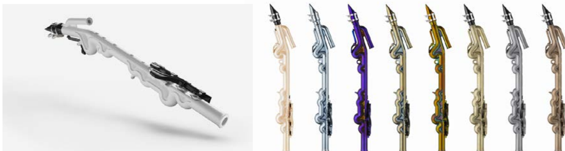
ヤマハ カジュアル管楽器「Venova」 左：通常製品 右：東京モーターショーエディション（参考展示）

当社は、ヤマハ発動機の協力のもと、両ヤマハそれぞれの製品に共通する世界観を表現し、訪れる人々が春の息吹(Breezin')を感じて新しい一歩を軽快に踏み出したくなるような展示にしたいと考えています。