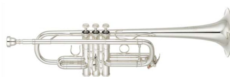
ヤマハ トランペット 『YTR-9445NYS-YM』