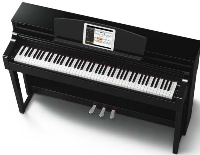
ヤマハ 電子ピアノ「クラビノーバ」 『GSP-170PE』 価格=328,000円（税抜き）