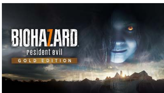
バイオハザード7 レジデント イービル ゴールド エディション

2018 年 1 月からの本格提供に先立ち、株式会社カプコンが 12 月 14 日(木)に発売予定のゲームソフト「バイオハザード7 レジデント イービル ゴールド エディション」(PlayStation®4/Xbox One/PC 用)、2018 年 1 月 26 日(金)に発売予定の「モンスターハンター：ワールド」(PlayStation®4 用)で、「ViReal Headphone」が先行採用されます。『ViReal』の高品質な立体音響がこれまでにない臨場感と没入感を“音”の面からも提供します。「モンスターハンター：ワールド」については、9 月 21 日から 9 月 24 日(一般公開日：9 月 23 日、9 月 24 日)にかけて幕張メッセで開催される「東京ゲームショー 2017」の株式会社カプコンブースにて体験できます。各ゲームタイトルの詳細については株式会社カプコンの公式サイトをご覧ください。