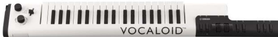
<ボーカロイドキーボード『VKB-100』>

ヤマハ株式会社は、キーボードで“歌を演奏する”という新しいスタイルのデジタル楽器、ボーカロイドキーボード『VKB-100』を12月より発売します。