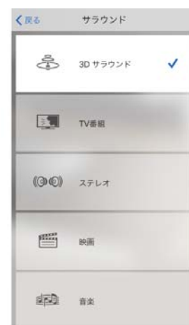
サラウンドプログラム画面