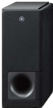
ヤマハ フロントサラウンドシステム『YAS-207』

http://jp.yamaha.com/products/audio-visual/hometheater-systems/hometheater-packages/yas-107_j/