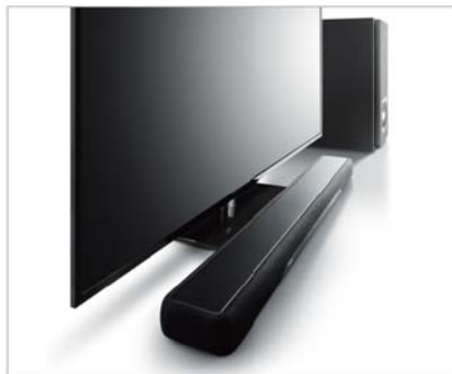
サウンドバー&ワイヤレスサブウーファー構成の「YAS-207」