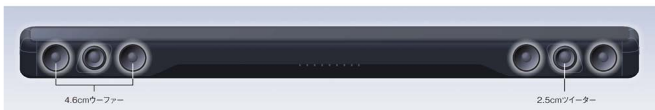
「YAS-207」サウンドバーのスピーカーユニット