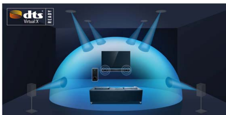
「DTS Virtual:X」バーチャル3Dサラウンド再生概念図