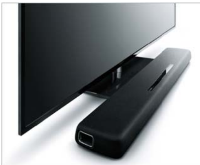
スリムなワンバーボディの「YAS-107」

*2 対応機種などの詳細は、当社製品サイト ( http://jp.yamaha.com/products/audio-visual/connect/hdmi_cec/ ) でご確認ください。