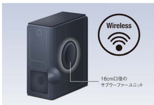
「YAS-207」ワイヤレスサブウーファーのスピーカーユニット