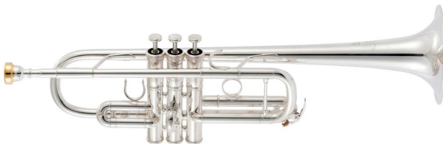
ヤマハ トランペット 『YTR-8445WS』 (調子 : C)