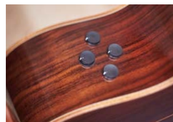
「SRT2」システム コントロール部 (A5/A3シリーズ)

上位機種となる『A5/A3シリーズ』には、「Aシリーズ」前モデルの上位機種や「APX/CPXシリーズ」の上位機種に採用して高い評価を得ている「SRT（Studio Response Technology：スタジオ・レスポンス・テクノロジー）」システムをさらに進化させた新開発の「SRT2」システムを採用しました。スタジオで一流のサウンドエンジニアがマイク録音したような空気感豊かなアコースティックサウンドが得られる「SRT」システムの音質はそのままに、機能を厳選してシンプルにすることで、ステージ演奏や練習シーンに適した高い操作性を実現しました。ピックアップ本体は各弦独立エレメント方式のピエゾピックアップを搭載しており、ピエゾピックアップのサウンドと「SRT2」システムによるサウンドを混ぜて、プレーヤーが求めるサウンドを容易に作り出すことが可能です。さらに、プレイスタイルや演奏曲に合わせて異なる2つのマイクタイプを選ぶこともできます。