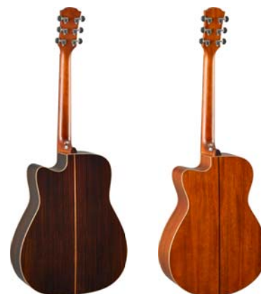
(左) ローズウッド/トラッドウエスタンカッタウェイ (右) マホガニー/フォークカッタウェイ