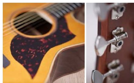
(左) ピックガード (右) 『A5 シリーズ』 ペグ

今回の新製品では、前モデルから好評を得ている外観デザインを継続して採用しました。華やかな装飾を廃しつつ、ボディ外周のバインディングや響穴象嵌*に木材を使用することで、木のあたたかみを感じさせるオーガニックで上質な印象を演出しています。ピックガードは、1970年代にトップアーティストに愛用された当社アコースティックギター