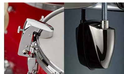
(左)DT50S / (右)アブソルートラグ

ダイカストボディにより、優れた耐久性を実現しています。またヤマハアコースティックドラムの代表的なラグとして多くのドラマーから支持を得ている「アブソルートラグ」を彷彿さ