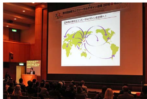
12月9日(金)名古屋国際会議場で行われた表彰式の様子