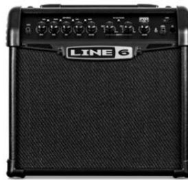
Line 6 ギターアンプ『Spider Classic 15』 10月下旬発売