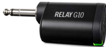
Line 6 ギター・ワイヤレス・トランスミッター『Relay G10T』 10月下旬発売