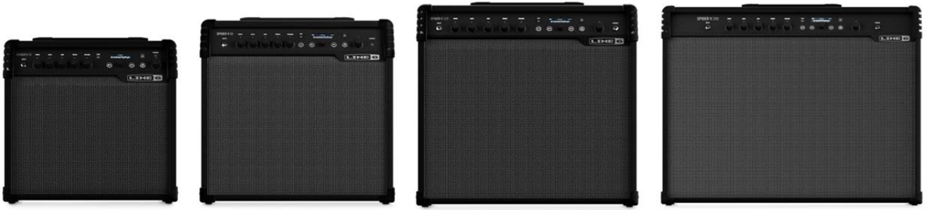
Line 6 ギターアンプ『Spider V シリーズ』 (左から)『Spider V 30』、『Spider V 60』 10月下旬発売 『Spider V 120』、『Spider V 240』 11月下旬発売