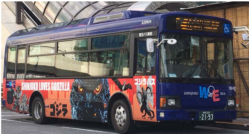
【新宿WEバス イメージ】

ヤマハと京王電鉄バスは、今回の実証実験を通して、外国人のお客様にもより利用しやすく、観光に適したバスのあり方を検証していきます。