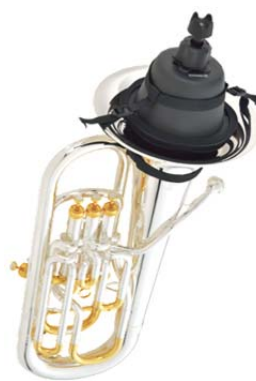
『SB2X』装着時 (ユーフォニアム本体は別売りです)