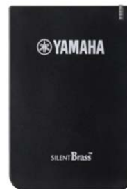
パーソナルスタジオ 『STX-2』

「パーソナルスタジオ」に、当社独自のデジタル音響技術「Brass Resonance Modeling」を搭載しています。「Brass Resonance Modeling」とは、ミュートを付けずに演奏した時の金管楽器の特性をモデル化し、ミュートを付けている時の音色を補正するデジタル技術です。「ピックアップミュート」先端部のマイクで取り込んだ音をデジタル処理してミュート独特のこもった音を緩和すると同時に、ミュート非装着時の“楽器のベルから演奏者の耳元に返ってくるまでの響き”を加え、まるでミュートを付けずに吹いているかのような自然な響きをイヤホンなどで聴きながら演奏することができます。さらに、楽器自体の響きだけでなく、空間への音の広がりや、演奏者の左右の耳に聴こえる時間・音量・音色の差まで調整して加えることで、あたかもミュートを付けていないかのような臨場感溢れるリアルな音空間を再現することが可能です。またミュートを意識せずに演奏できるため、必要以上に息を吹き込んだりすることなく、ミュート無しの環境に近い状態で練習できます。