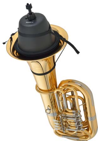
『SB1X』装着時 (チューバ本体は別売りです)

さらに本製品の「ピックアップミュート」では、調整ロッドでヘッドの位置を変えることで、ベルの大きさや演奏者の好みによって音程や吹奏感を調節することができます。チューバの場合、1つのミュートでB♭管、C管、E♭管、F管に対応可能です。