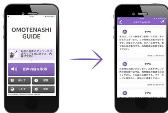
ヤマハ「おもてなしガイド」アプリのイメージ

©尾田栄一郎/集英社・フジテレビ・東映アニメーション ©バードスタジオ/集英社・フジテレビ・東映アニメーション ©岸本斉史 スコット/集英社・テレビ東京・びえろ