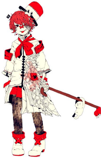
イメージキャラクター