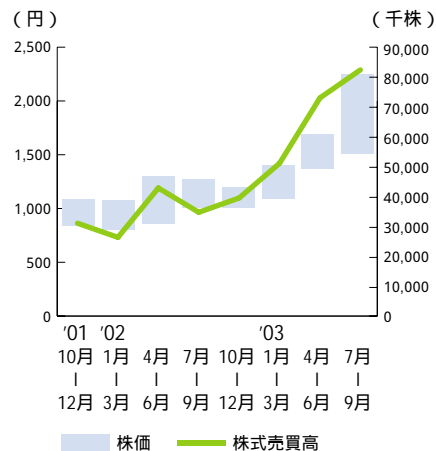
株価および株式売買高の推移 (東京証券取引所)