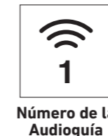
Número de la Audioguía

* Si desea volver a escuchar una vez más desde el principio, introduzca otra vez el número de la Audioguía y pulse el botón de reproducción.