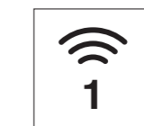
Número de la Audioguía

Para cada objeto expuesto se puede ver un número de la Audioguía. Seleccione el número de la Audioguía en la lista de la aplicación para reproducir el audio para ese objeto expuesto.