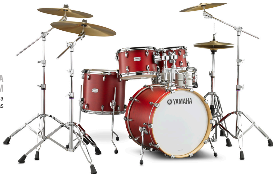
YAMAHA TOUR CUSTOM Batería típica de cinco piezas